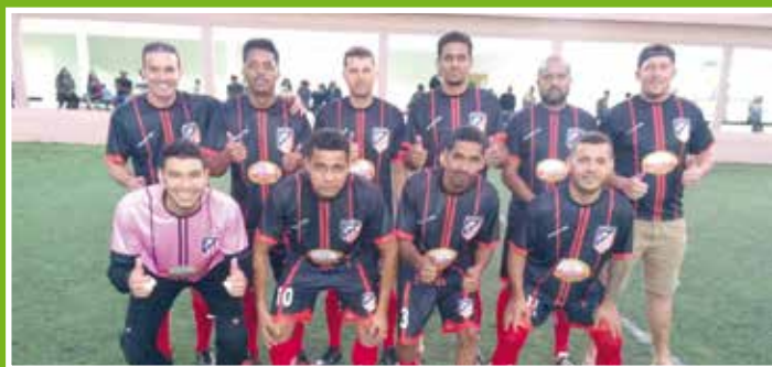
Vice-campeão: Atlético Roca