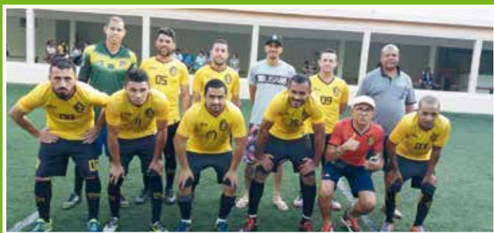
Campeão: Roca B