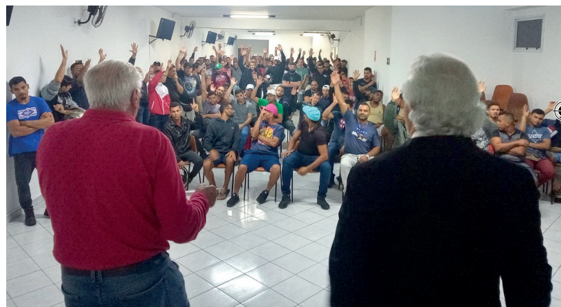
Trabalhadores mobilizados para aprovação da proposta