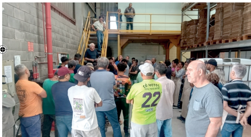
Trabalhadores da MGA